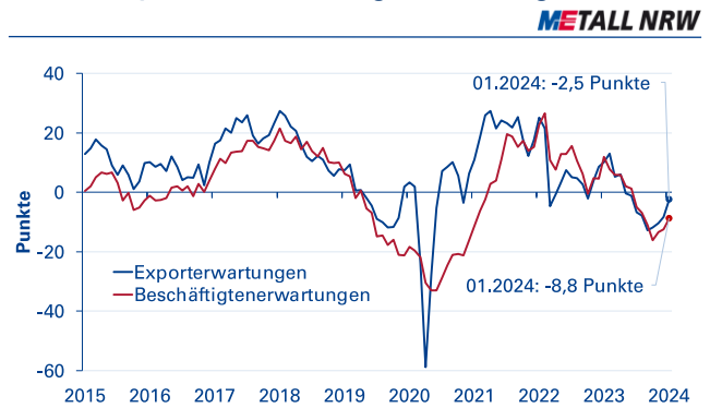
Abb. 2: Export- und Beschäftigterwartungen

Anmerkung: Saisonbereinigte Werte.